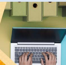
Illustrazione normativa di riferimento